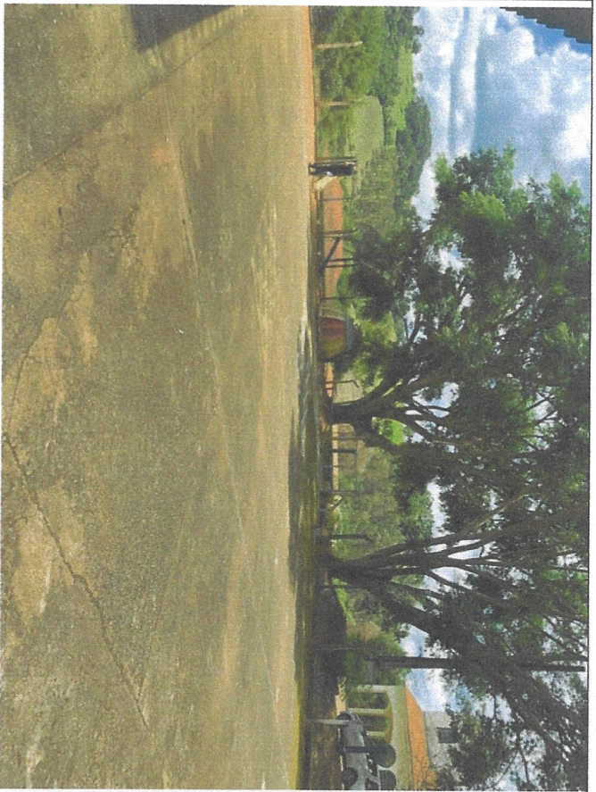
Descrição: foto local de instalação da quadra, lateral Esquerda