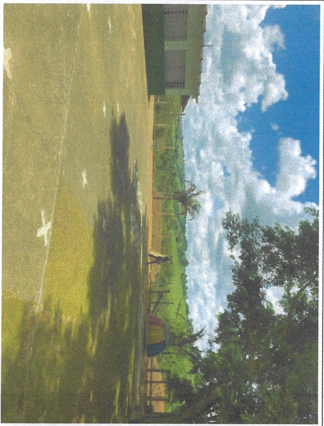
Descrição: foto local de instalação da quadra, lateral esquerda aos fundos