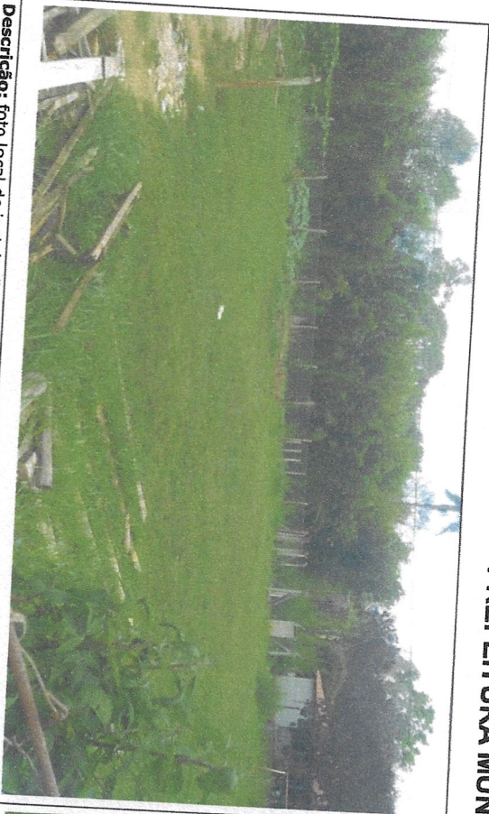
Descrição: foto local de instalação da quadra, lateral Esquerda