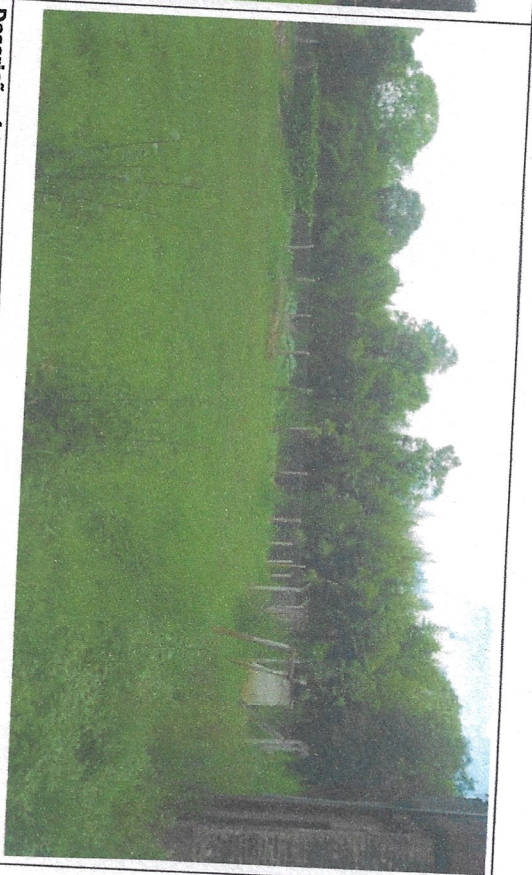
Descrição: foto local de instalação da quadra, lateral esquerda aos fundos